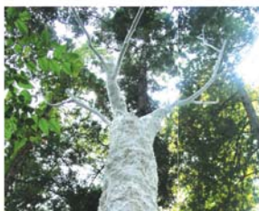
Kurono Yuichiro / 2008 / ユグドラシル