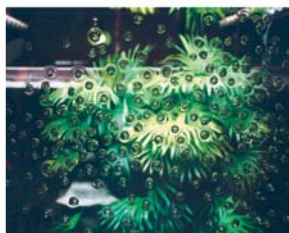
Komatsu Aya / 2003 / 庭一建仁寺