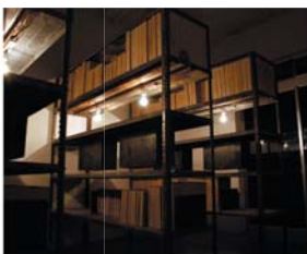
Ishii Takahiro / 2009 / 棚