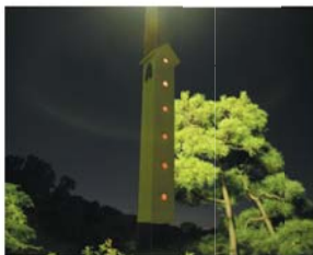
Takashima Ryozo / 2008 メゾン・ド・オワソー