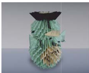
Akatsuka Rieko / 2006 / Kappa