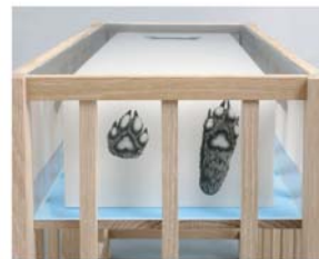
Sarah Woodfine / 2008 / Boy