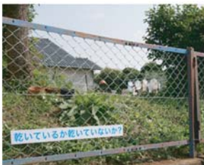
Taniyama kyoco / 2008 乾いているか乾いていないか？