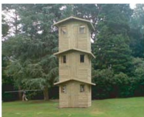
Nicky Coutts / 2008 A Tower in the Minds of Others