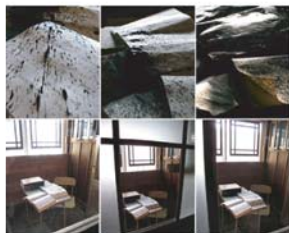
Katrin Paul / 2008 / sorosoro