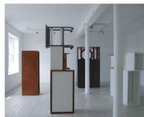
Sam Stocker / 2009 Without whch it could not be